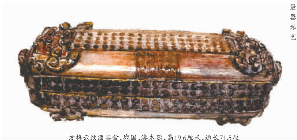
方格云纹酒具盒，战国，漆木器，高19.6厘米，通长71.5厘米，宽25.6厘米，国家一级文物，1986年湖北荆门包山2号墓出土，现在收藏于湖北省博物馆

成都博物院院长王毅认为，中国漆器在汉代已经是一种普遍的手工业技艺。它最东到了安徽、浙江，南边到广西、云南。中国漆器在汉代，成都的技艺是最顶级的，并且成都漆器行销海内外，影响力很大。这更表明成都是中国漆器艺术中心，是中国手工业高地，彰显了汉唐时期成都国际化大都会地位。