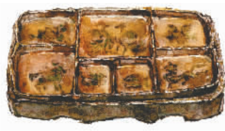
漆榻，漆木，长25.4厘米，宽16.3厘米，高4.8厘米，朱然墓出土，现在收藏于马鞍山市朱然家族墓博物馆

成都博物馆的专家指出，秦汉三国时期，成都地区的漆器生产尤为发达，汉朝中央政府在成都地区设立的蜀郡工官，是汉代最早设立也是最著名的工官之一。除此之外，广汉郡也以制作漆器而闻名。琉璃的光影、精美的技艺与那幻化的色彩连缀在一起，构成了成都漆艺的独一无二，这项始于上古，兴于秦汉的技艺经过数千年的传承，在如今的成都散发着熠熠的光芒。