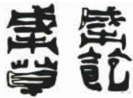
马王堆漆器“成市草”“成市饱”铭