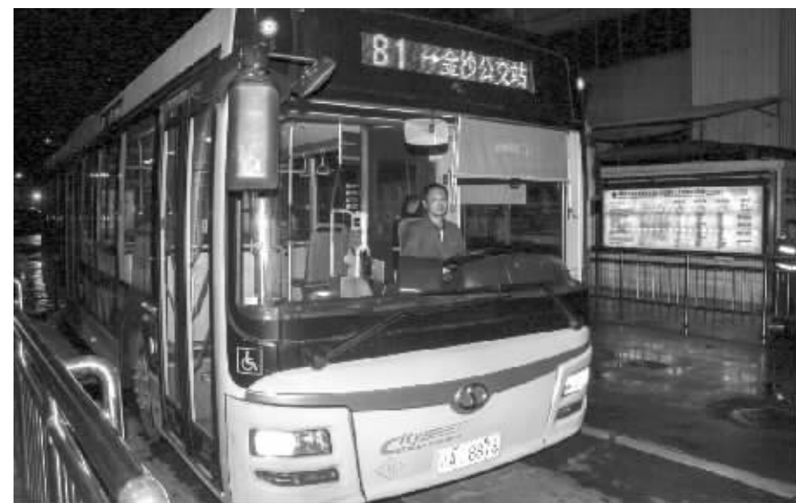
81路公交车最后一次运营