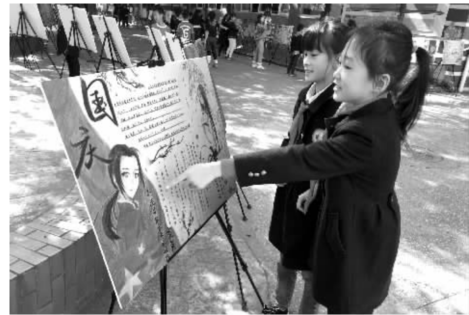
巡展现场,孩子们欣赏着节日小报

教师节,孩子们在“节日小报”上画出红烛下老师批改作业的模样;成都地铁10号线一期开通,孩子们用彩笔绘出成都便捷的公共交通体系;中秋节、国庆节,孩子们写下对传统节日的理解、对祖国繁荣昌盛的祝愿……昨日,由市文明办、市教育局主办,成都晚报社、“讲文明 树新风”成都文明创建全媒体平台承办的“童眼看蓉城 我来当小编”2017年成都市“节日小报”系列创评活动第二次巡展,走进成都市花园(国际)小学。巡展现场,120幅优秀获奖小报吸引了孩子们驻足观看。