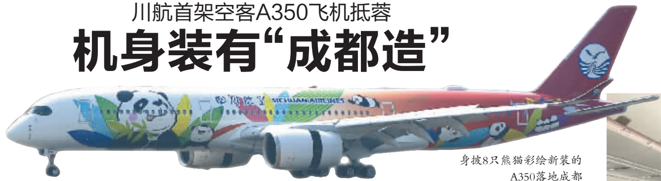
身披8只熊猫彩绘新装的A350落地成都

经过10小时的飞行，昨日上午10时48分，四川航空首架身披8只熊猫彩绘新装的空客A350飞机抵达成都双流国际机场。8月16日，该架飞机将迎来首航，执飞3U8885成都至北京航班。此后，A350将执飞北京、上海等地航线，并适时投入国际航线运营。