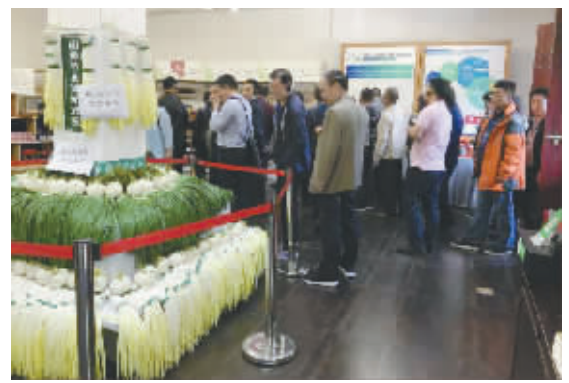
观众参观农村双创展会