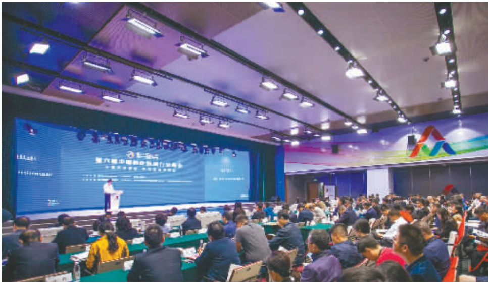
第六届中国创业投资行业峰会

作为2018年全国大众创业万众创新活动周成都主会场重要活动之一，昨日，“第六届中国创业投资行业峰会”在成都菁蓉汇举行。峰会以“不忘创投初心，服务高质量发展”为主题，来自全国各省、市级发展改革委和创投备案管理部门，创业投资机构、金融机构、行业协会及财经媒体代表等400余人出席了会议。会上发布了《国家创业投资发展报告(2017)》。