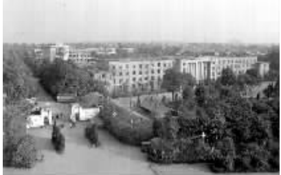
当年420厂的厂貌