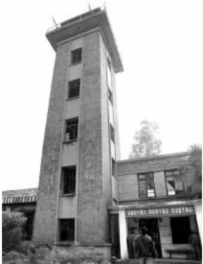
昔日的消防瞭望塔

420厂当年的位置如今是华润24城,而这个曾为东郊工业立下赫赫战功的消防瞭望塔,被保留进了东郊工业博物馆。