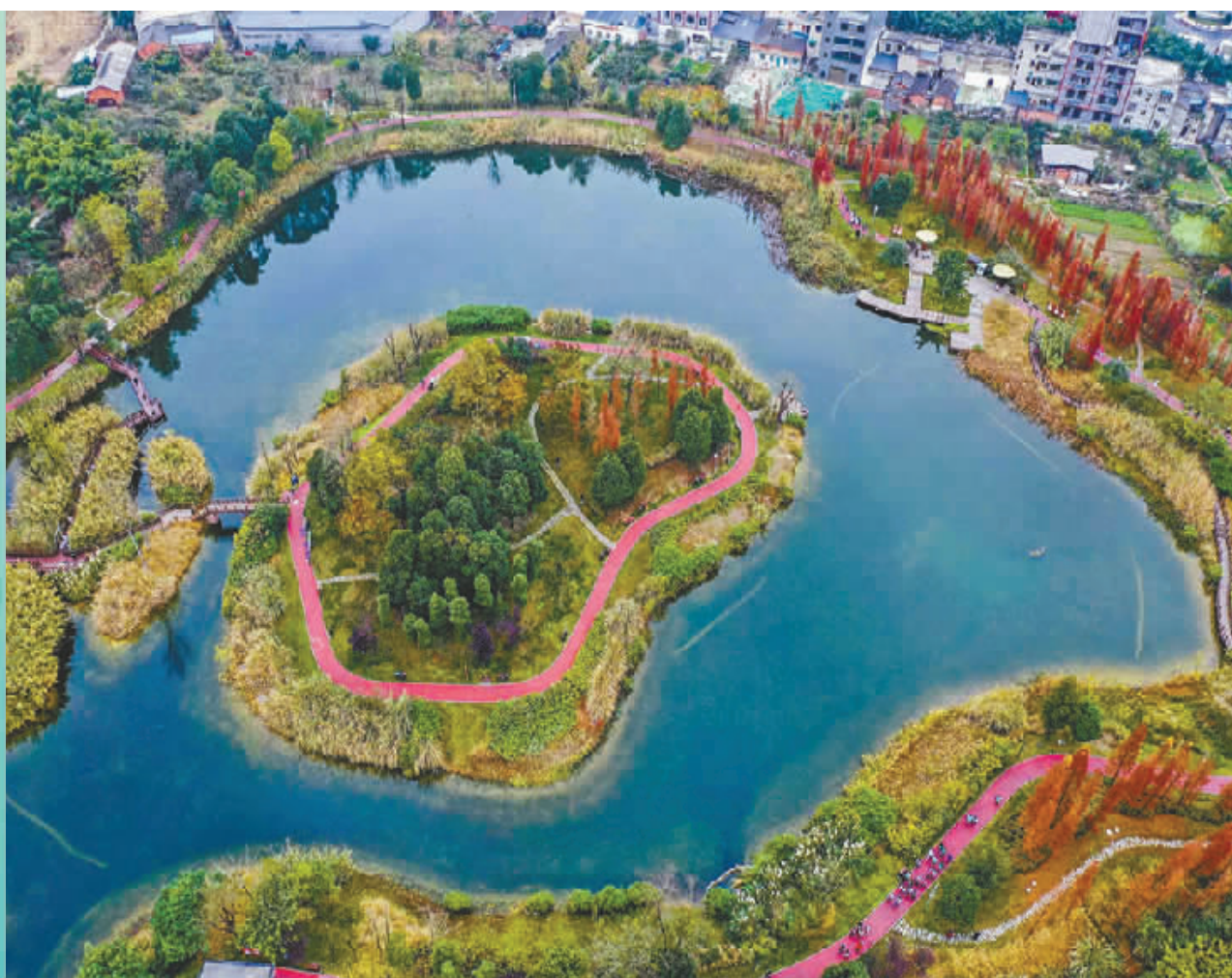
龙泉驿区洛水湿地公园健身步道