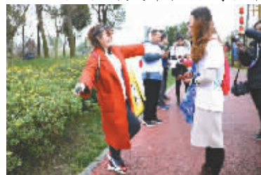
市民尝鲜，跟着APP学动作