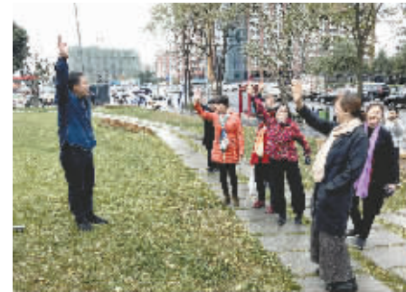
市民举手“票选”心仪的绿地名称

5、“个人中心”主要是用于用户查看个人积分和兑换“奖品”的板块。“积分”主要通过每日登录APP签到获得积分。