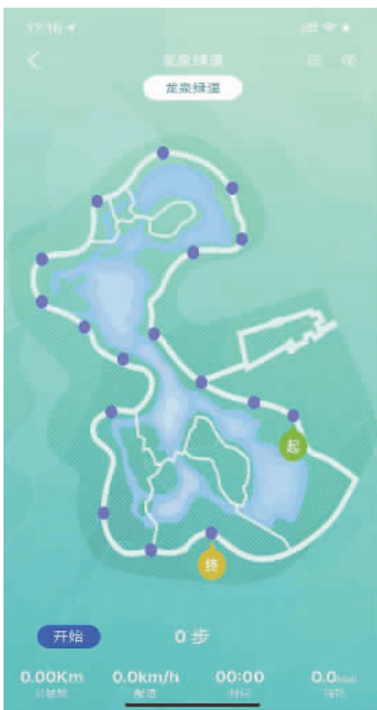
手机客户端页面显示的绿道内相关设施。

随着天府绿道建设加速，绿道健身已逐步成为市民健身的新时尚。如何更科学地健身，怎样找到适合自己的健身方式，就非常重要了。“智慧绿道”就可以帮你解决这一切。昨日，“运动成都、绿道健身”科学健身智慧绿道示范段启动仪式在龙泉驿区洛带湿地公园绿道举行，来自各区(市)县的500余名市民在“街边见水、巷边见水、水水相连”的洛带湿地公园绿道上体验了一次科技含量十足的健身活动。