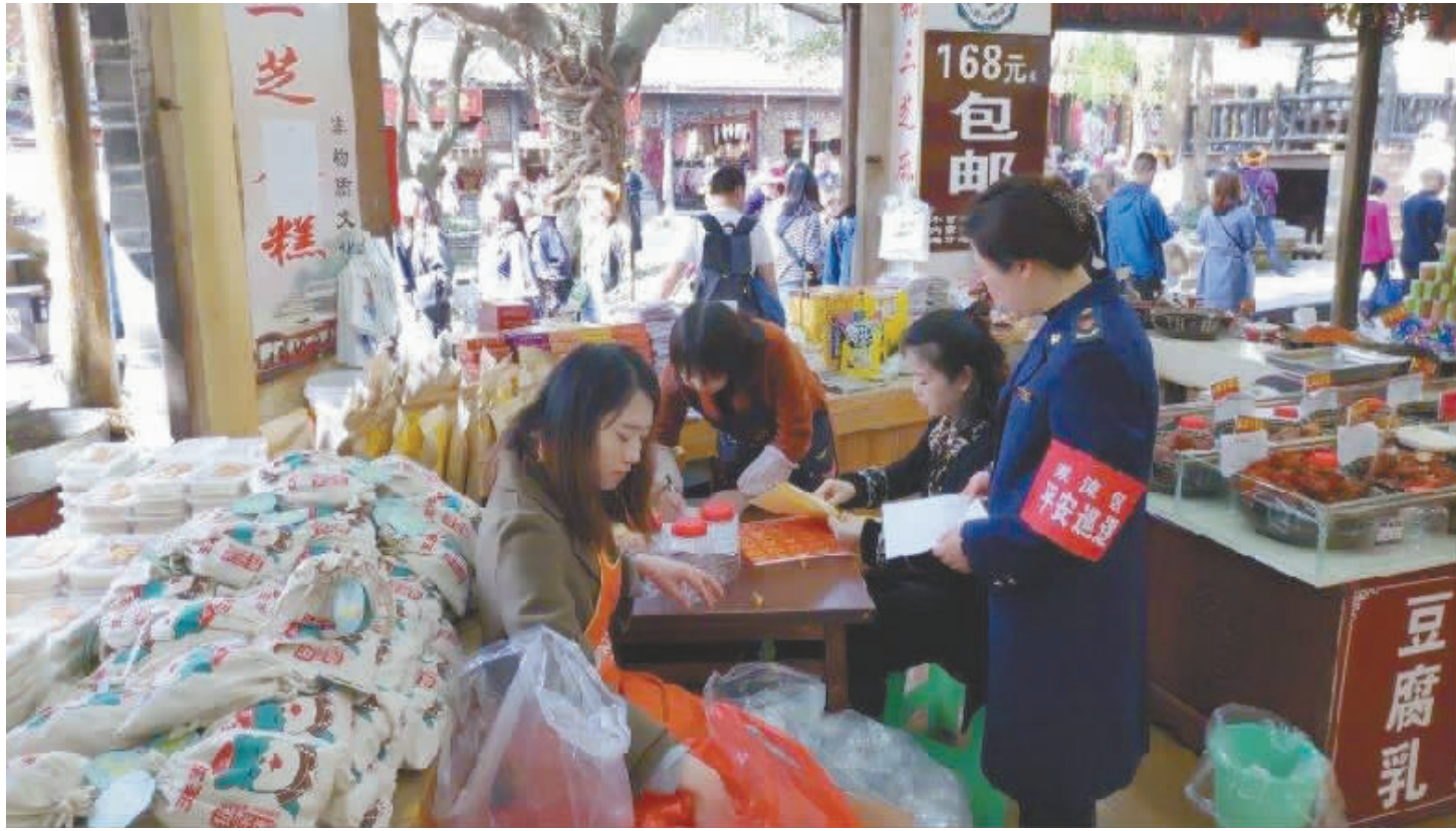
双流区市场监督管理局开展安全检查

昨日,记者从双流区获悉,该区平安社区工程百日攻坚行动工作组办公室已组织7个牵头部门研究形成了“1+9”行动方案体系(1个总体方案、9个专项行动方案)及相关配套文件,梳理了9类37项突出问题和风险隐患,明确了整改措施、责任部门和完成时限。