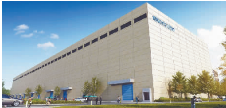
成都影视硅谷摄影棚效果图

昨日,成都科技影视文创产业功能区举行2019年一季度项目集中签约暨摄影棚群落建设启动仪式。记者从郫都区了解到,通过此次集中签约仪式,将引入国家级超高清重点实验室、西南融媒体中心、5G超高清研究院及视听内容基地、5G泛娱乐融媒体视频基地等项目落地成都科技影视文创产业功能区,协议资金达28.2亿元。这也意味着成都科技影视文创产业功能区年度产业招商和项目建设大幕正式拉开,将为郫都区加快建设国家级超高清视听研制基地和助力成都“三城三都”建设注入强劲动力。