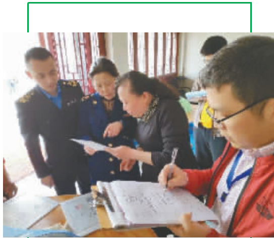
对突出问题和风险隐患进行排查和整治